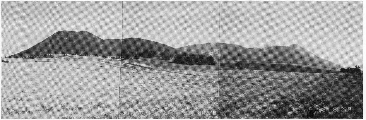
写真1. Ciomadul 火山を北西からみる. 複数のドームの集合体であることがわかる. 手前の緩斜面は, 火砕流・土石流堆積面. 詳細は, 本誌掲載の守屋ほか論文の Fig. 5 参照.